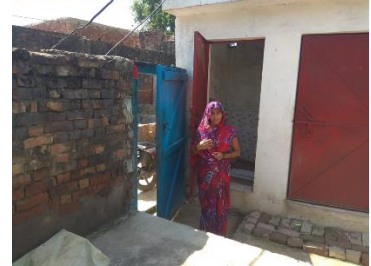
Neha und Ajrun, Indien 13