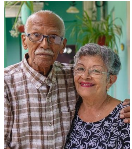
Ehepaar aus Oaxaca, Mexiko 12

Der Fonds investiert in Darlehen, die an MFIs in Schwellen- und Entwicklungsländern vergeben werden. Die MFIs dienen als Schaltstelle zwischen dem IIV Mikrofinanzfonds und den Endkreditnehmer:innen. Entsprechend gewissenhaft werden die Institute ausgewählt. Der Auswahlprozess umfasst eine detaillierte Länder-, Finanz- und Sektoranalyse sowie eine Überprüfung des MFIs vor Ort. Neben Finanzkennzahlen, Kredit-, Ausfall- und Währungsrisiken wird auch die Qualität der Unternehmensführung bewertet. Es werden nur solche MFIs unterstützt, die auch im Hinblick auf ethische und soziale Aspekte unseren Kriterien entsprechen.