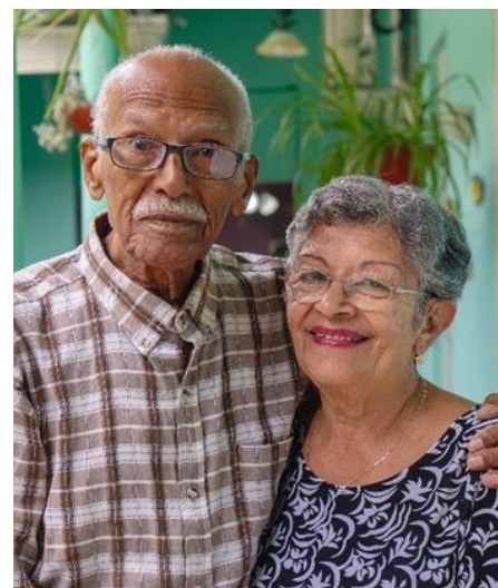
Ehepaar aus Oaxaca, Mexiko 13

In dieser angespannten Situation ist der Zugang zu Finanzdienstleistungen wichtiger denn je. Der Finanzdienstleister Bayport Financial Services Mexico agiert seit 2014 mit dem Ziel unterversorgte Rentner:innen und Beschäftigte des öffentlichen Sektors diesen Zugang zu ermöglichen. Bayport Mexico bieten ihren Kund:innen Kredite mit unterschiedlichen Laufzeiten an, deren Rückzahlung als Abzug ihres Lohns/Pension abgewickelt wird. Eine Kundengeschichte aus dem südlichen Bundesstaat Oaxaca ist ein pensioniertes Ehepaar. Ihre Pension reicht Ihnen derzeit nicht aus, um ihren Lebensunterhalt zu decken. Daher haben Sie sich entschieden ein kleines Lebensmittelgeschäft im Erdgeschoss ihres Wohnhauses einzurichten. Den dafür benötigten Kredit hat Ihnen Bayport Mexico gewährt. Dieser wurde schnell ausgezahlt und somit konnten sie die Lebensmittel für das Geschäft vorfinanzieren. Das Geschäft ist eine stabile Einkommensquelle für das Paar.