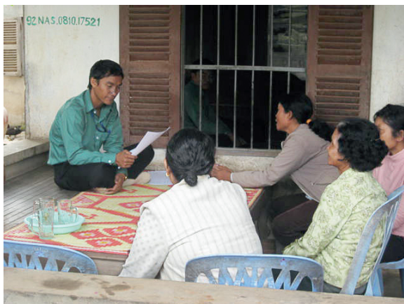
Gruppenkredit an eine Frauengruppe in Kambodscha

Dieses Dokument richtet sich an professionelle Anleger und dient lediglich der Information. Die hier dargestellte Meinung ist die des Autors der Frankfurter Allgemeinen Zeitung. Diese Meinung kann sich jederzeit ändern. Obwohl große Sorgfalt darauf verwendet wurde um sicherzustellen, dass die in diesem Dokument enthaltenen Informationen korrekt sind, kann keine Verantwortung für Fehler oder Auslassungen irgendwelcher Art übernommen werden, wie für alle Arten von Handlungen, die auf diesen basieren. Herausgeber ist INVEST IN VISIONS GmbH mit Sitz in 60596 Frankfurt, Kennedyallee 119a.